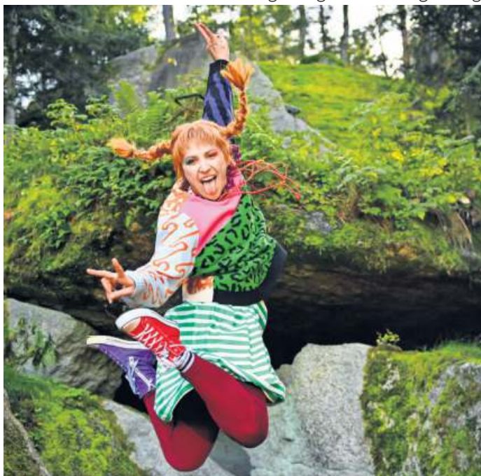
Im Kinderstück macht 2024 Pippi Langstrumpf die Felsenbühne unsicher.

zieht revoltierend in den Wald. Auch dort will man sie „richtig“ zusammenfügen. Doch leider setzt der Elf Puck den Liebessaft seines Herrschers Oberon falsch ein und würfelt alle Gewisshei-