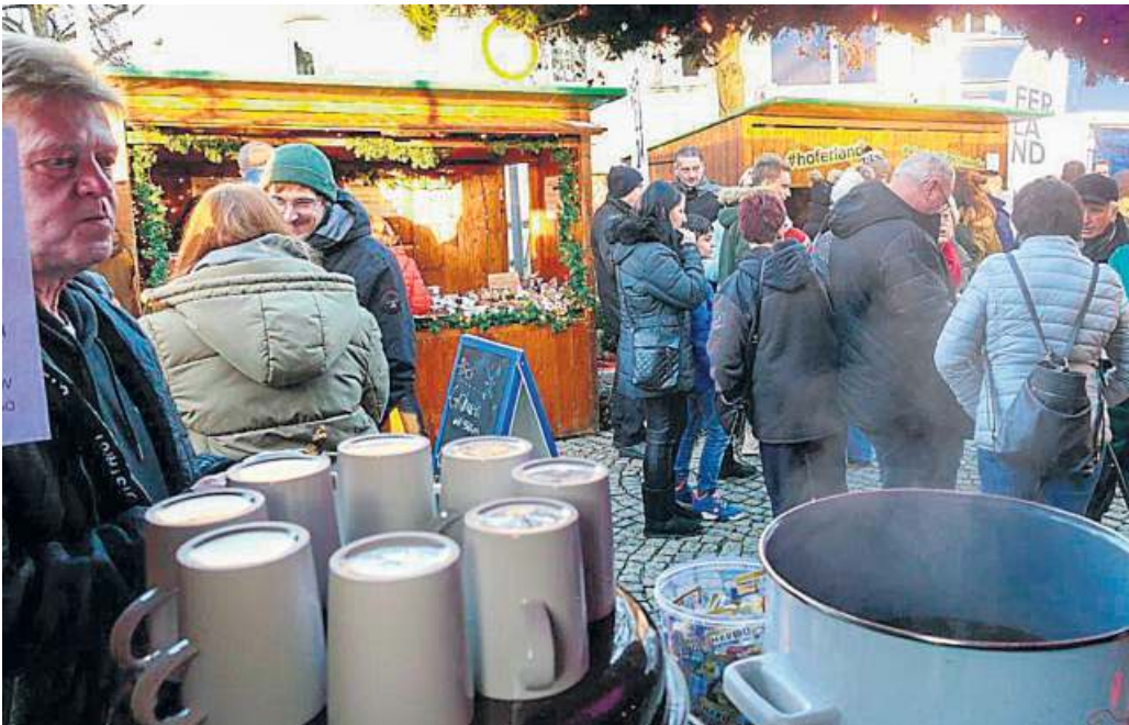
Gemütlich über den Markt bummeln, Freunde treffen und bei einem Glühwein die Zeit genießen – der Naalicher Rupperichmarkt lädt heute dazu ein, sich auf die Adventszeit einzustimmen.