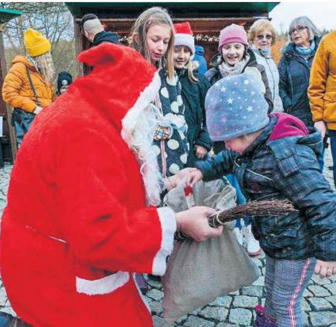
Für die Kinder hat der Nikolaus sicher auch heuer wieder Süßes dabei.

Aufgrund von Tiefbauarbeiten im Bereich der Kreuzung Hauptstraße und Anger („Sparkassenkreuzung“) in Naila, wird der Verkehr in diesem Bereich bis Freitag, 8. Dezember, durch eine Baustellenampel geregelt. Betroffen sind laut einer Mitteilung der Stadt Naila die Hauptstraße, die Albin-Klöber-Straße, der Anger und die Westermstraße. In den genannten Bereichen wird ein absolutes Halteverbot, damit der Durchgangsverkehr gewährleistet bleibt.