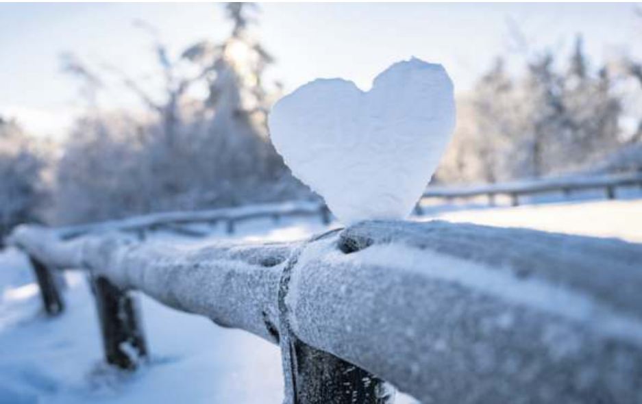
Die Kälte kann unserem Herz-Kreislaufsystem ganz schön zu schaffen machen.

Sanfte Bewegung wie Spazieren und Walken sind auch an kalten Tagen drin. Doch alles, was das Herz zu stark belasten könnte, lässt man besser sein, wie die Herzstiftung rät. So etwa das Schneeschippen. Der Grund: Bei vielen Herzpatienten ist nach zehn Minuten Schneeschippen die maximale Herzfrequenz erreicht. Und schon wer nur für zwei Minuten die Schneeschaukel schwingt, kann das Herz stark belasten. Wer diese Aufgabe nicht abgeben kann, sollte zumindest einen Schal