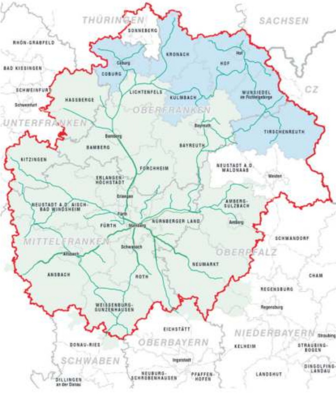
Das VGN-Verbindungsgebiet ab 1. Januar 2024.

Infostand: Am Samstag, 16. Dezember, wird es zum Thema VGN-Beitritt einen Infostand auf dem Hofer Weihnachtsmarkt geben. Von 10 bis 16 Uhr werden dort Fragen beantwortet.