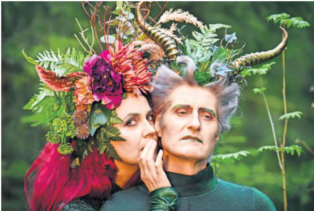
Mit Shakespeares Komödie „Ein Sommernachtstraum“ zeigt die Luisenburg 2024 einen echten Klassiker.

William Shakespeares berühmteste Komödie „Ein Sommernachtstraum“ beginnt mit einem Ideal der Liebe. Doch die Eltern und ihre Sprösslinge haben durchaus konträre Vorstellungen davon. Die Jugend