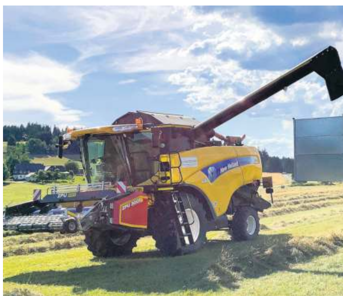
Mit einem umgebauten Mähdrescher werden die gemähnten Schwaden aufgenommen und schließlich die reifen Wiesensamen gedroschen.