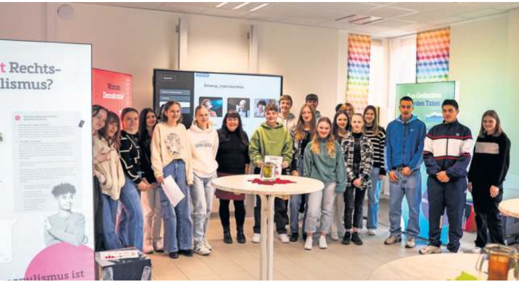
Mit dem wichtigen Thema Demokratie befassten sich die Schüler der Realschule Helmbrechts im Rahmen einer Ausstellung.